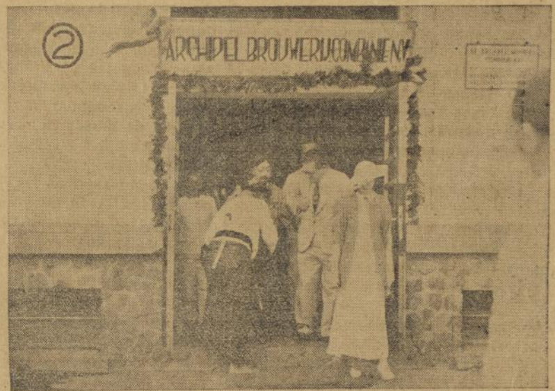
Sri Soenan moelai melihat paberik Archipelbrouwerij.